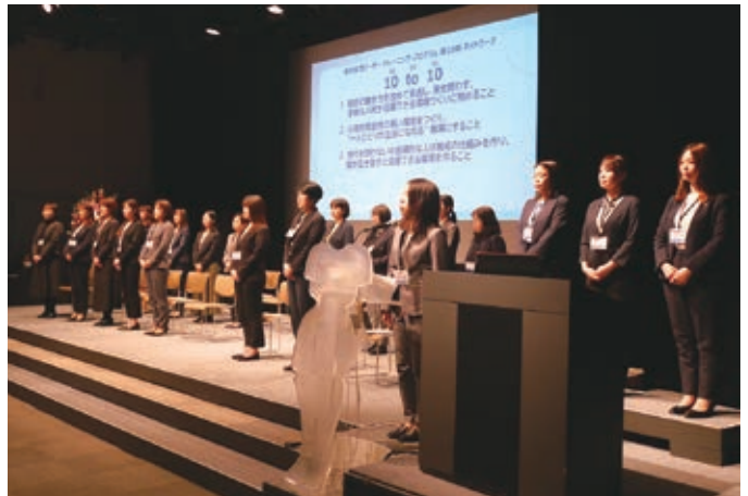
2024 マネージャーコース修了式

問合せ：(公財) せんだい男女共同参画財団 仙台市男女共同参画推進センター エル・ソーラ仙台 管理事業課