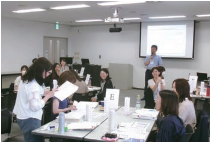
2024 マネージャーコース プログラムの様子