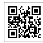
その他 SNS はこちらから (リンク集)