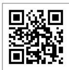
フォーラム専用ページ (センターHP内)

仙台市男女共同参画推進センターでは、公式ホームページやInstagram、X、note 等で最新情報を発信しています。各グループのフォーラム企画についても広報していきますので、ぜひチェックしてみてください。フォローもお願いします！