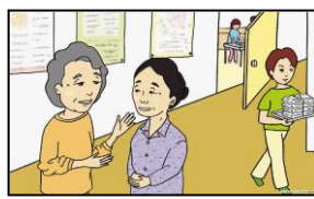
話し合いで使うイラストの一例

このワークショッププログラムは、市民の有志の方々とせんだい男女共同参画財団職員が結成した「せんだい防災プロジェクトチーム」が作成しました。